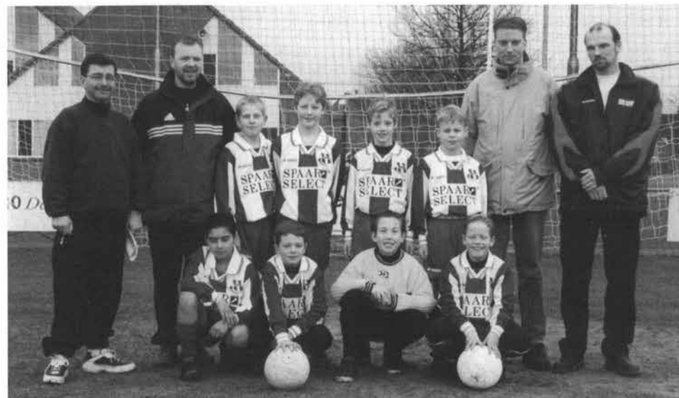
SpaarSelect tenue sponsor E1 en E2